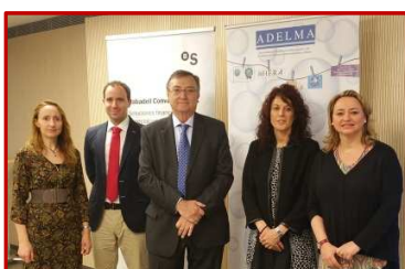
Presidente y Secretaría ADELMA