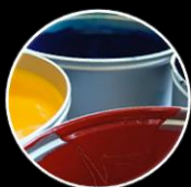
Sustancias Químicas (REACH)