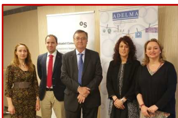
Presidente y Secretaría ADELMA